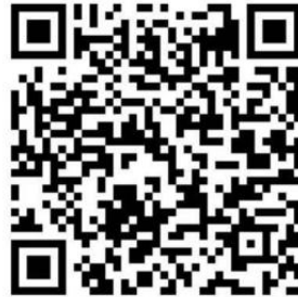
公共危机与应急管理交流微信二维码