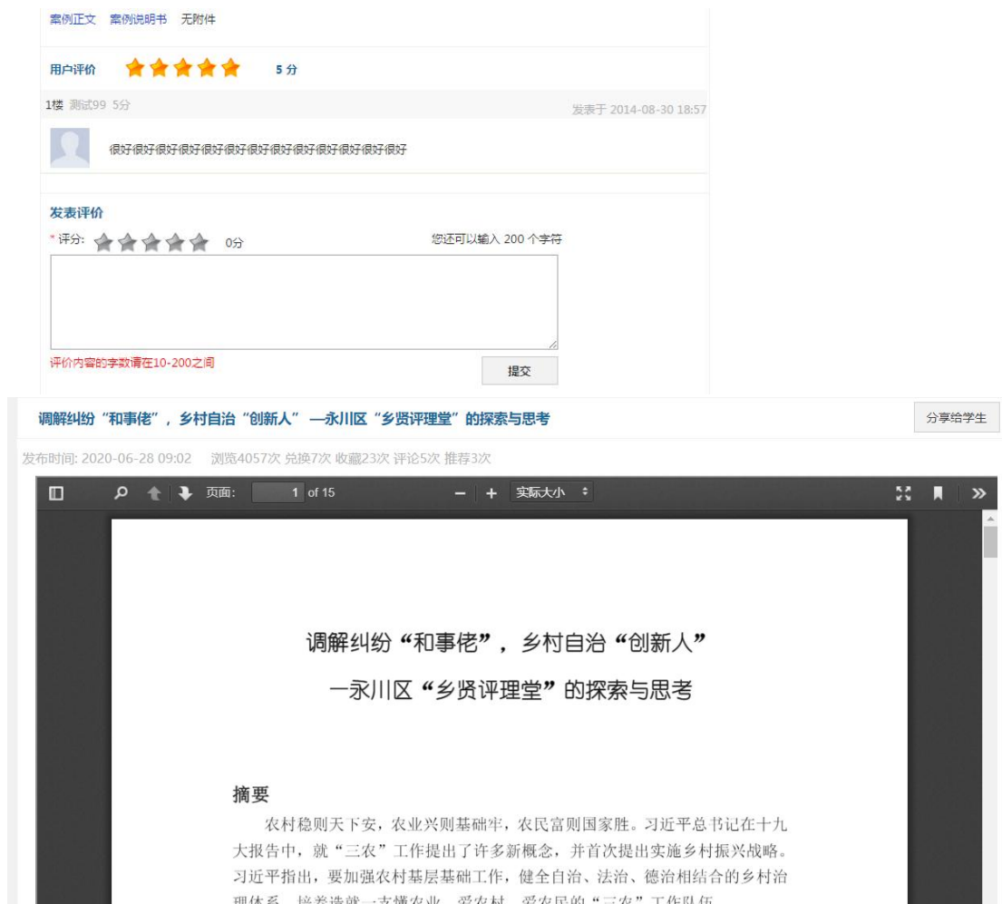
图 1.3 案例基本信息和案例正文