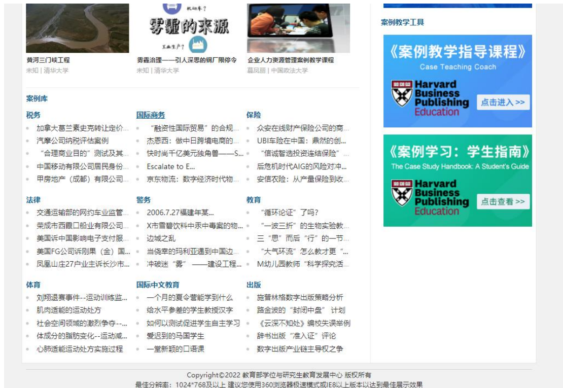
图 1.1 平台首页